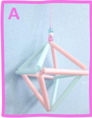
A ヒンメリオーナメントをつくろう 作業時間 約40分