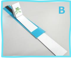
B ぴよんぴよん! マグネット